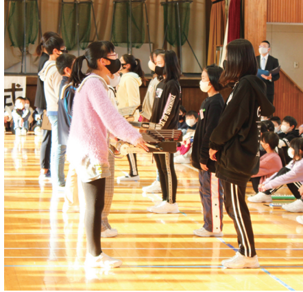
▲ 6年生から5年生へ思いを込めて楽器などが手渡されました。

6年生の日頃からの姿勢や鼓笛隊を大切にする気持ち、そして演奏の素晴らしさは、次の伝統を守る5年生にしっかりと伝えられました。