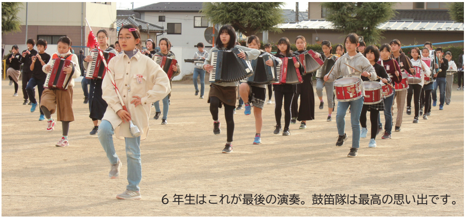
6年生はこれが最後の演奏。鼓笛隊は最高の思い出です。