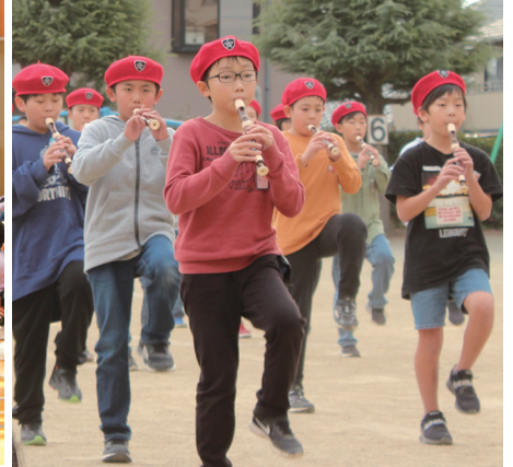
▲ 5年生は下級生に憧れられる鼓笛隊を目指します。