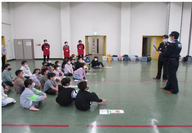
☆おまわりさんからのお話

大河原警察署の方々に来ていただき、子供たちが防犯に関するカルタ取りをしながら、防犯意識を遊びの中で楽しく学んでいました。