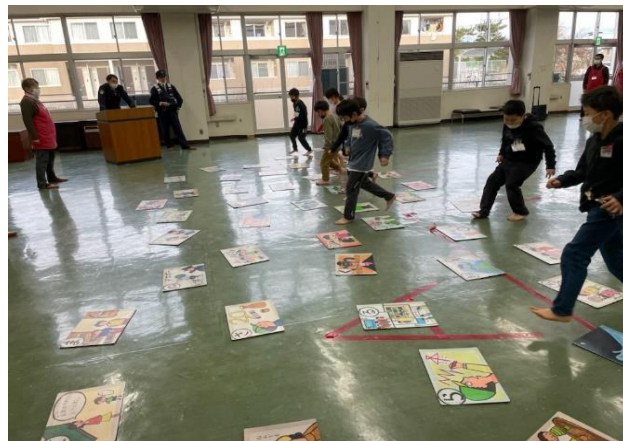
☆取り札はどこかな！