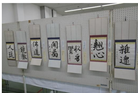
課外書道教室の展示

令和5年度の町民文化祭(展示の部)を、10月28日(土)・29日(日)の2日間で開催しました。たくさんの方々から作品を展示していただき、大いに盛り上げることができました。準備運営にご協力いただいた皆様、ご来場いただきました皆様、ありがとうございました。