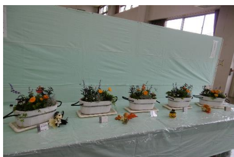
金ヶ瀬公民館「花の寄せ植え コーディネーター教室」の作品