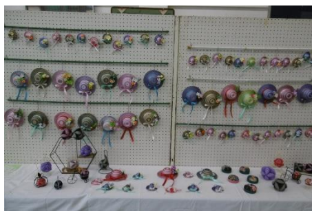
金ヶ瀬下町長寿会の手工芸品