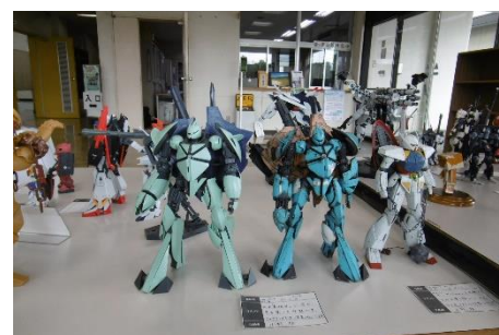
大河原模型クラブの展示

その他にも、絵画・豆本・竹細工・パッチワークキルト・がま口バッグなど様々な個人作品が展示されました。出展いただきました皆様、ありがとうございました。