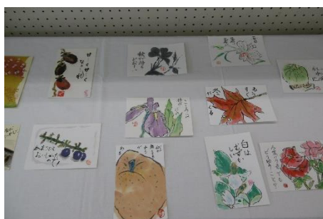
金ヶ瀬公民館「絵手紙教室」の作品