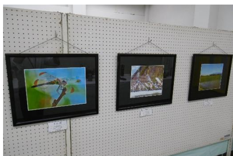
金ヶ瀬フォトクラブの写真