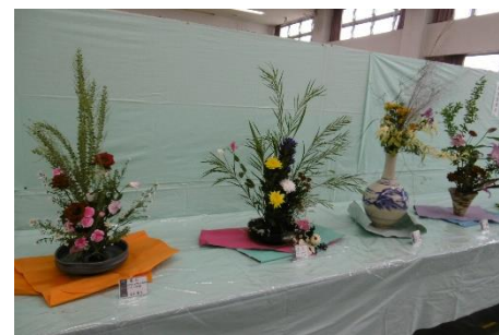
櫻花倶楽部の生花