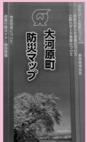
▲ 大河原町防災マップ

2019年度から2029年度にわたるまちづくりの計画となります。まちの将来像やまちづくりの方向性が示されています。