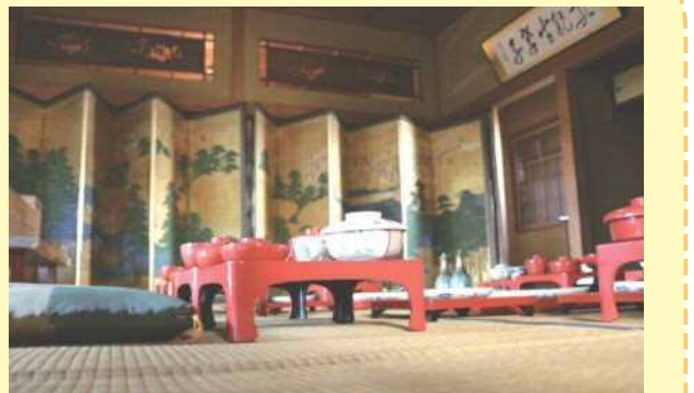
▲佐藤屋プロジェクト「佐藤屋所蔵の品々」(佐藤屋邸)