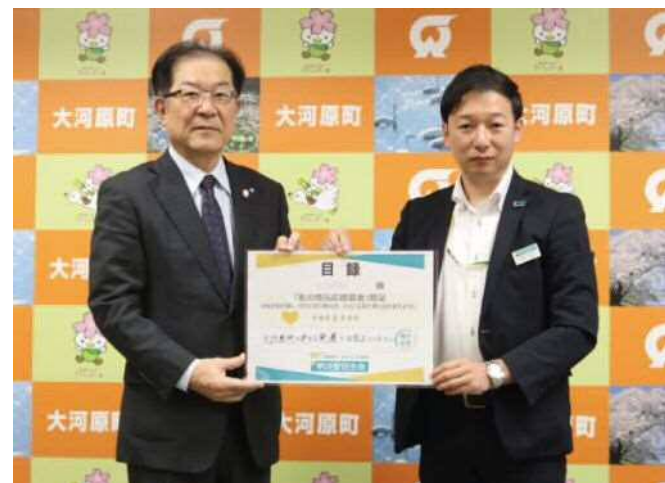
▲目録を手渡す大河原営業部 中山部長(右)