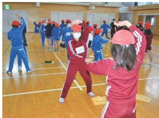
▲3年生に踊りを教える4年生

大小の伝統 大小ソーラン！ 大河原小学校の良き伝統として、運動会での大小ソーランの発表があります。4年生の子どもたちが校庭いっぱいに広がり、リズムミカルな曲に乗って、大きな動きで踊ります。 この発表に向けて、例年、3学期になると、4年生から3年生に大小ソーランの引き継ぎが行われます。4年生と3年生がペアやグループになり、一つ一つの踊りを教えていきます。4年生は踊って見せたり、3年生の踊りを見てアドバイスをしたりあげたりしながら大小ソーランが引き継がれていきます。 また、この大小ソーランの発表のときに着用するはっぴは、大河原小学校父母教師会や地域の皆様を取り組んでいるベルマーク運動によって、そろえられたものです。 大小の学校文化として根付いた大