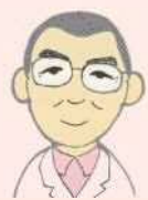
町内在住の樹木医