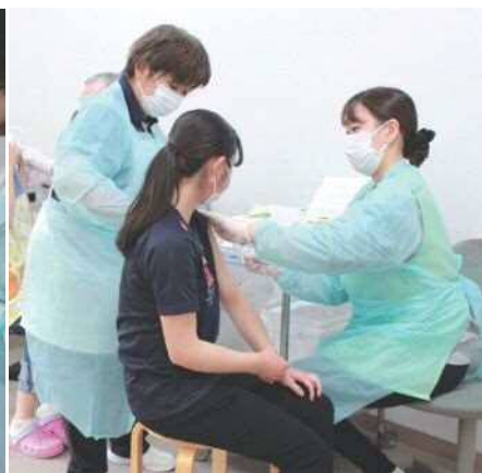
▲ 4/28 特別養護老人ホーム桜寿苑で利用者・職員へワクチン接種