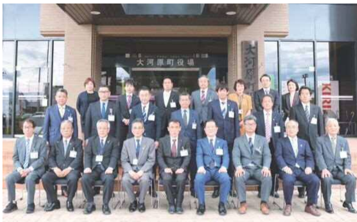
▲議会議員、監査委員、町長、副町長、教育長、議会事務局職員

議会開催中は、議場の傍聴席で傍聴することができるほか、町のホームページ内で映像をライブ配信していますので、ご利用ください。