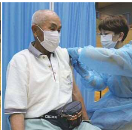
▲ 集団接種会場。肩を出しやすい服装でお越しください