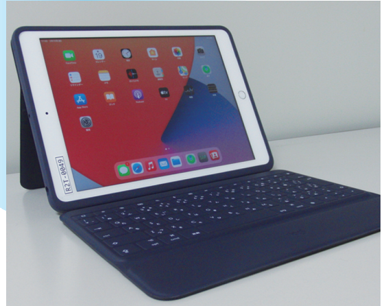
キーボード・ケース付き i P a d

「 学び 」を保障する手段としての 1人1台の i P a d 導入 により 個別最適な学び と 協働的な学び が実現可能に