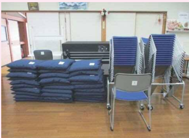
今年度の助成金で整備された備品（上谷東集会所）