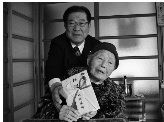
▲時折見せる笑顔がとても素敵のとくいさん。好きな食べ物は煮物だそうです。

旧金ヶ瀬村出身のとくいさんは、近所の長山家に嫁いで、農作業などの傍ら、5人のお子さんを育てられました。現在は、長男家族に見守られながら大病もすることなく穏やかに過ごされています。これからもどうぞお元気で過ごしてください。