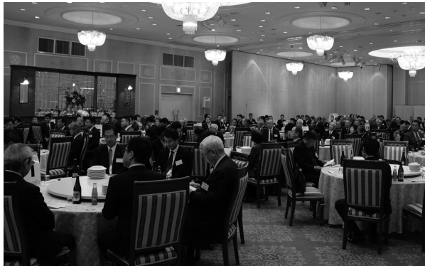
▲多分野のかたが参集し、貴重な意見交換の場となりました。

新年を迎え、町の発展に向けた意見を交換する「大河原町新春賀詞交歓会」が1月5日ウエディングパーク桜フロアで開催され、町内企業や行政区長、各種団体の代表など200名以上が参加しました。