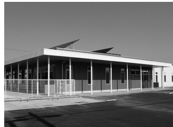
▲ファミリー・サポート・センターは世代交流いきいきプラザのなかにあります。

「時間が出来たので何か地域の役に立ちたい」「自分の子育ての経験を生かしたい」そんな思いと「仕事が遅くなる日は保育園のお迎えが心配」「病院に行きたいけど子どもの世話が…」そんな願いをつなぐのがファミリー・サポート・センターです。子育ての援助を行いたいかた(提供会員)と、子育ての援助をお願いしたいかた(依頼会員)が会員として登録し、お互いの信頼関係に基づいて相互援助活動を行います。ファミリー・サポート・センターは、地域で安心して子育てができる環境、子育てを互いに支え合うネットワーク作りを目指します。