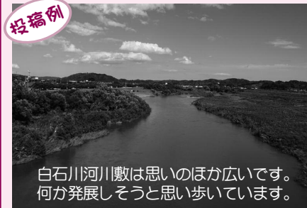
投稿例 白石川河川敷は思いのほか広いです。何か発展しそつと思ひ歩いてます。

町のホームページから「歩きたくなるまちおおがわら」のインターネットサイトに入れます。このサイトをもっと活用し、歩いていけるからこその町内の見所、歩き所、季節感がある場所、癒しポイントなどを皆さんから集めて、様々な情報が入った楽しいネット掲示板にしたいと思います。町内の見所、歩き所などがわかる写真やコメントをメールで送ってください。手紙や電話でも構いませんので、ぜひ、町の魅力ある情報をお知らせください。