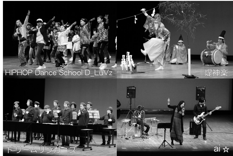
HIPHOP Dance School D_LuVz 堤神楽 ai ☆

▼ステージ発表では、町内から出演した団体が他市町に負けないうらい会場を盛り上げました。