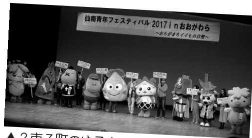
▲2市7町のゆるキャラが勢揃い!! 文化祭に花を添えました。