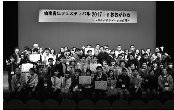
▲今回の仙南青年文化祭の実行委員を務めた2市7町の青年たち。

当日は、ダンスやバンド演奏などのステージ発表や、写真や制作した美術作品などの展示、今回のテーマが「おらが町イイもの自慢」ということで、2市7町の青年たちによる市町自慢ブース「S-1グランプリ」なども開催され、会場は終始大勢の来場者で賑わいました。