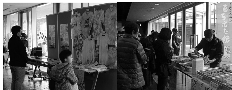
▲展示された作品にも若さが溢れ出ていました。 ▲お昼には、「もちぶた館」のお弁当や豚汁などが来場者のお腹を満たしました。