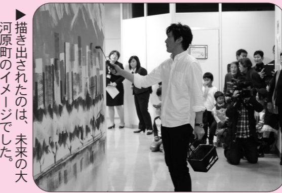
▶描き出されたのは、未来の大河原町のイメージでした。

④ベビーエリア こちらのエリアは赤ちゃんとお母さんたちが触れ合える専用スペースとなっており、おむつ替えや授乳ができるスペースとなっています。