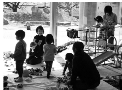
「えずっこ広場」 あったかい親子の ふれあい広場