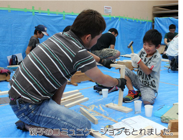
親子のコミュニケーションもとれました。

大河原町建設職組合青年部と(株)まちづくりオーガが協働で行う「親子木工教室」が、7月24日にオーガで開催されました。今年で10回目となる教室では、熊本の震災復興を応援するため、熊本県産の畳表 のこぎり を使って、「座畳椅子」を作りました。普段、鋸や金槌を持ったことのないお父さんお母さんも、子どもたちにお手本を見せようと一生懸命がんばりました。子どもたちも一緒に板を切ったり、釘を打ったり、楽しみながら作品を作りました。夏休みの思い出の一つとなったようです。