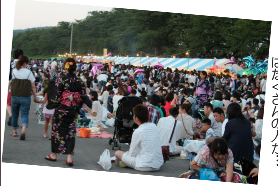
▲開始時間前から会場にはたくさんの人々が…

また、お盆前後には地区などの夏祭りも多数開催され、盆踊りはもちろん、伝統的なおみこしが町内を練り歩いたり、町内のあちこちで夏の風物詩を感じることができました。