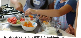
▲きれいに盛り付けて…

7月27日、大河原町保健センターで開催された「夏休み！キッズクッキング(主催：ヘルスメイト大河原・大河原町)」。今回は、「スープパスタ」と「ミルクかんとん」を作りました。参加した子どもたちは、材料を量ることから、洗ったり、切ったり、煮たり、焼いたり、ヘルスメイトのかたにアドバイスを受けながら、友達と一緒に自分たちの力で料理を仕上げ、最後に完成した料理をみんなで食べました。