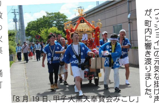
「8月19日、甲子大黒天奉賛会みこし」