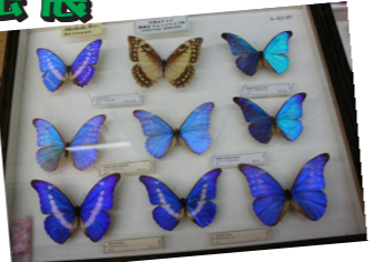
▲色鮮やかな蝶など、昆虫の標本がたくさん。

会場では、「生きた昆虫観察コーナー」もあり、子どもたちはヘラクレスや虹色クワガタなどの珍しい昆虫を間近で見て、とても興奮した様子でした。