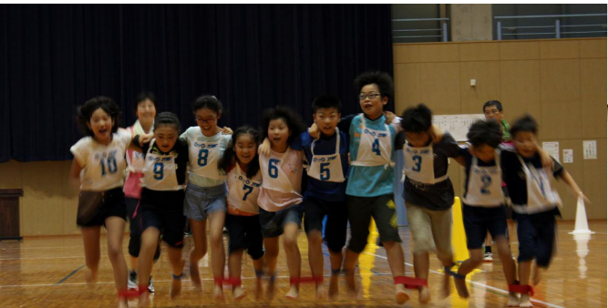
高タイムを狙って、ゴールを目指して1・2・1・2!!(10人11脚)

この大会は、地区対抗で行われ、子どもたちは日頃地区ごとに練習してきた成果を思う存分発揮すべく、全力で競技に臨みました。お世話役や応援にかけつけた大人たちも、子どもたちへ大きな声で声援や掛けを送り、会場は熱気に包まれました。