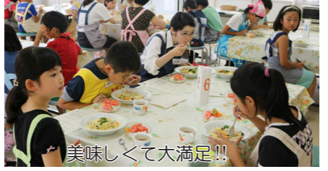
美味しくて大満足!!