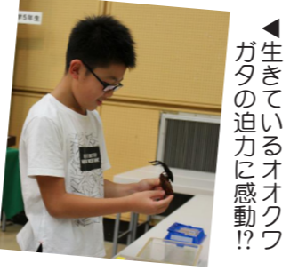
▲生きているオオクワガタの迫力に感動!!