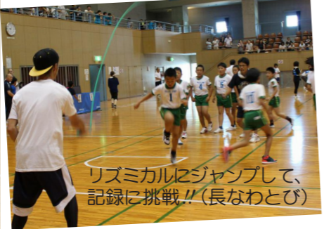
リズムカルにジャンプして、記録に挑戦!!(長なわとび)