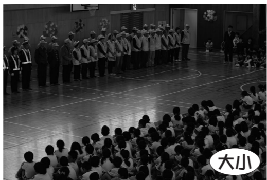
地域の方々に見守られ、安全に登下校

また、1年生は1泊2日で花山に宿泊学習に行きました。スコアオリエンテーリングや野外炊飯、学級学年交流活動などを行いました。それぞれ振り返りの時間を設け、充実した活動になりました。この期間留守を守っていた2年生は、学年行事でドッジボール大会を行い、学級の団結を強めました。