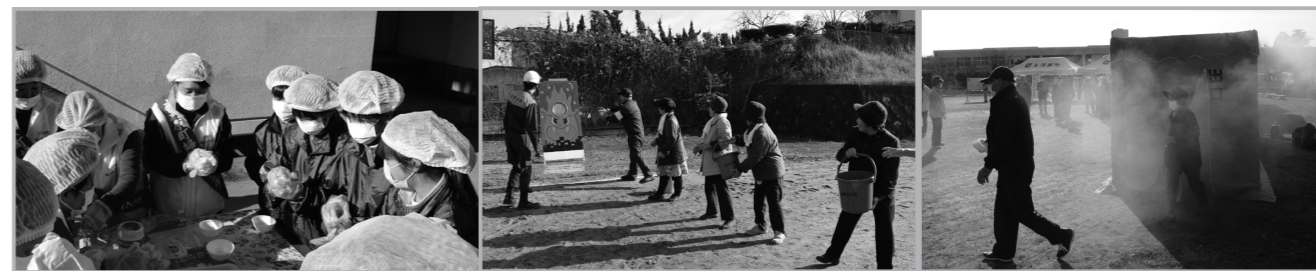
▲大中学生も参加し、700個のおにぎりをはぎ出した炊き出し訓練。 ▲みんなで力を合わせ初期消火。バケツリレー訓練。 ▲火災時を想定して、実際に煙中通過を体験。

総合防災訓練 平成23年3月11日に発生した東日本大震災を教訓に、大規模災害発生を想定した総合防災訓練が、11月22日に南小学校グラウンドにて開催されました。今回の訓練は、「平成27年11月22日午前8時45分ごろ、宮城県沖で震源の深さ約24km、規模はマグニチュード9.0と推定される大規模な地震が発生し、それとほぼ同時刻、蔵王山が噴火した。この地震により本町では震度6弱の揺れを感じ、また、蔵王山の噴火にともない、風向きにより本町にも火山灰が降る恐れがある。一部地域では家屋が倒壊、道路などの公共施設や電気・電話・水道・ガスなどのライフラインにも被害が生じ、住民の避難が必要になった」という想定で行われました。 訓練対象は大河原町全域、全町民。今回は「住吉町区」「原前区」「南原前区」「上谷1・2・3区」「上大谷区」を訓練重点地域として、陸上自衛隊や大河原消防署などの協力を得て、広報訓練、警備・交通規制訓練、避難・住民初期対応訓練のほか、実地訓練として、炊き出し訓練、火災防訓練、救出救護訓練などが行われました。 災害はいつ襲ってくるかわかりません。日頃から万が一の事態に備えて、防災減災の正しい知識を身に着けるとともに、避難場所などの確認をしておきましょう。