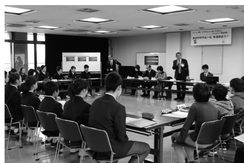
詳細は学校単位で取り決めを行います。

「おおがわらルール」 「明日青のつどい2015」で、各学校のこれまで取り組んできた成果などが発表されました。そこでは取り組みにより改善されているものの、一部ルールが守られていないという実状も浮かび上がってきました。 その実状を踏まえ、12月10日にプロジェクト緊急会議が開催されました。児童生徒・PTA・校長会代表との積極的な意見が交わされ、「おおがわらルール」として小中学生のスマートフォンなどの午後9時以降の使用を禁止することが決まりました。 大切な子どもたちの未来のために、町全体で考え、サポートしていくためのルールとなります。