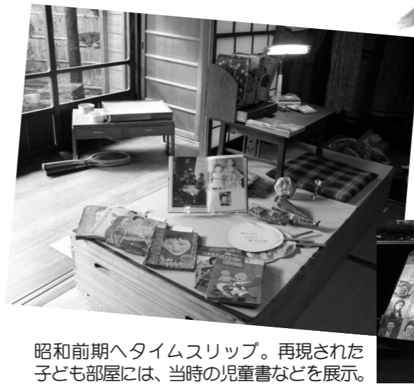
昭和前期へタイムスリップ。再現された子ども部屋には、当時の児童書などを展示。

11月1日から3日までの3日間、旧家「佐藤屋敷」で「戦後70年、目で見える昭和前期の歴史「郷土と生活」展」(主催：佐藤屋敷プロジェクト)が開催されました。 今年、昨年の「明治」から「昭和前期」へ焦点を変え、当時の人々の生活の様子を資料や実物、映像などで再現しました。佐藤屋敷の所蔵品のほか、町の民俗資料収蔵室などに収蔵されている生活用具なども披露されました。 ここでは、「郷土と生活」展の一部をご紹介します。