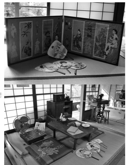
家族団らんの光景が目浮かぶような、懐かしい雰囲気漂う茶の間。