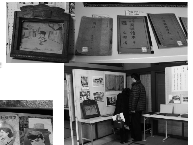
他にも紙芝居や当時の教科書など、興味深い品々が多数展示されました。