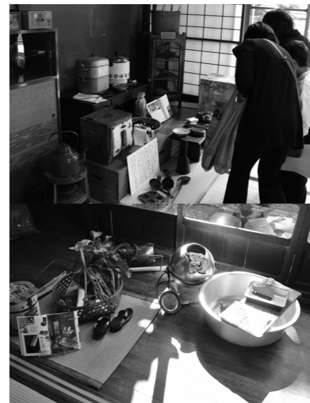
昭和前期に使われていた炊飯器や冷蔵庫・洗濯用具などで、当時の生活空間を再現。