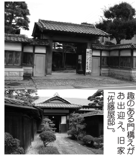
趣のある門構えがお出迎え。旧家「佐藤屋敷」。