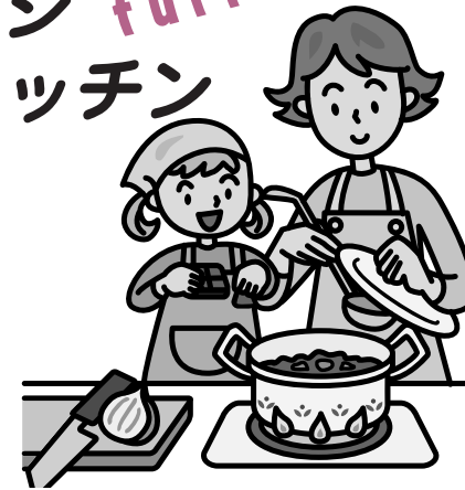
ヘルスマイトの野菜たっぷり簡単レシピ