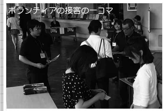
ボランティアの接客のーコマ えずこホール ☎ 52-3004 URL http://www.ezuko.com

えずこホールボランティアスタッフはホールの主催事業で接客やバーコーナーを担当しています。参加者は大河原町を中心に主婦や会社員、学生など職業、年齢もさまざまです。来場したお客さまに気持ちよく舞台を楽しんでいただき、喜んでいただけることをやりがいに感じ、劇場スタッフとしておもてなしの心を持って楽しい活動を展開しています。そんな私たちの活動も開館以来まもなく20年目を迎えようとしています。そして、これまで楽しく活動ができるような工夫もしてきました。例えば、ボランティア・ポイント。活動に参加するとポイントが付くというものです。主催公演以外にもミーティングや研修会なども対象でポイントを貯めることができます。それらを使って主催事業の招待券と交換ができるなどうれしい特典となっています。 また、企画・運営や接客のノウハウを学べたり、さまざまな研修プログラムも充実。ときには劇場に赴いて舞台公演を観たり、そこで活動するボランティアさんたちと交流を図ったり、ワクワク、ドキドキ、やりがいを感じる活動なのです。感動の舞台は、たくさんのボランティアスタッフの手によって支えられています。あなたもアートに関わるボランティア活動を通し、新しい仲間を輪を広げてみませんか。2015年度新規参加者募集中!! 参加費無料。高校生以上ならどなたでも参加できます。詳細は下記まで。