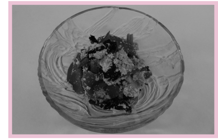
おがらのごまミルク和え