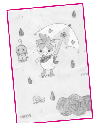
▲梅雨のさくらっきー♡