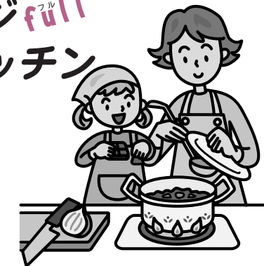
ヘルスマイトの野菜たっぷり簡単レシピ