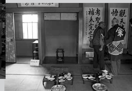
後藤新平など著名人の書も飾られた貴賓室