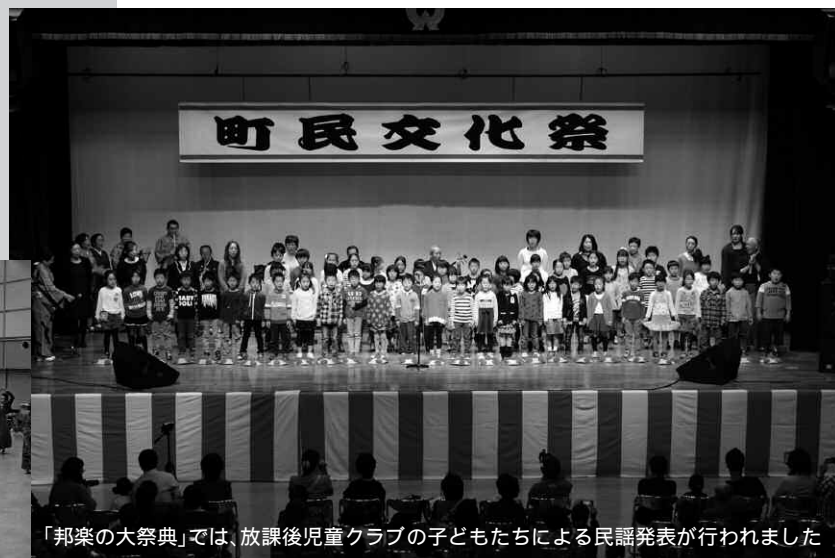
「邦楽の大祭典」では、放課後児童クラブの子どもたちによる民謡発表が行われました