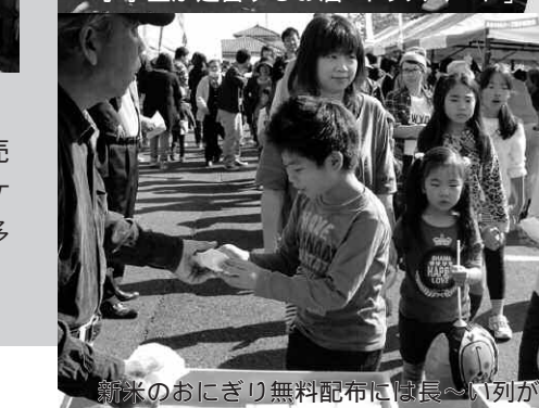
新米のおにぎり無料配布には長〜い列が