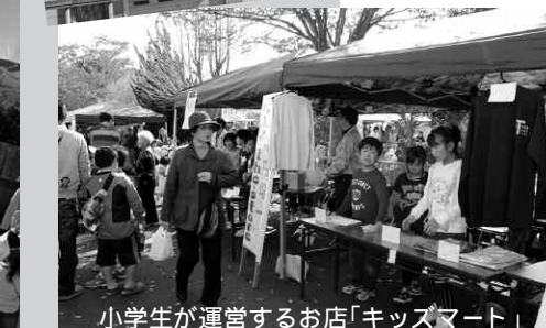
小学生が運営するお店「キッズマート」