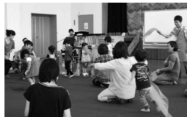
▲スカーフなどの道具を使って、ピアノのリズムに合わせて楽しく踊る子どもたち。