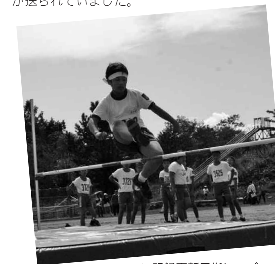
▲記録更新目指してジャンプ!