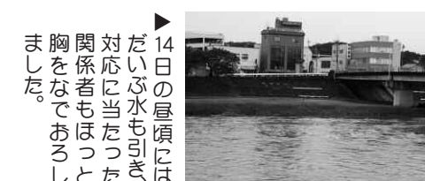
▲14日の昼頃には、胸関対応だましをな者でもおるとした

10月中、1週間で2度の台風は非常に珍しいとのことですが、自然災害はいつも予想のつかない被害をもたらすもの。日頃からいざという時の備えをしておきましょう。