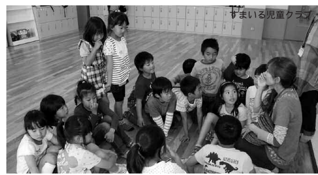
まいる児童クラブ

すべての子育て家庭を支援するため、地域子育て支援拠点事業（子育て支援センター）や利用者支援事業など、地域のニーズに応じたさまざまな子育て支援を行います。