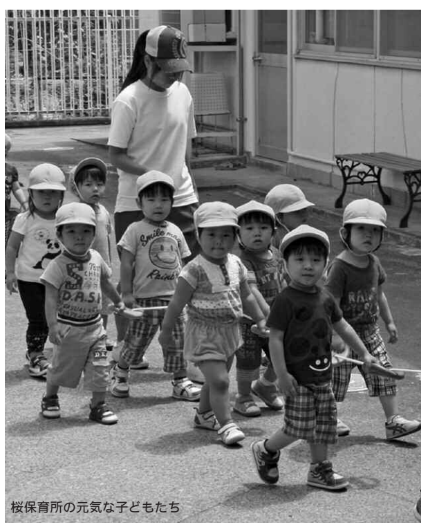
桜保育所の元気な子どもたち

利用調整の結果、入所が見込まれない場合、支給認定証及び待機登録通知を送付。その後、欠員が生じた場合、再度選考