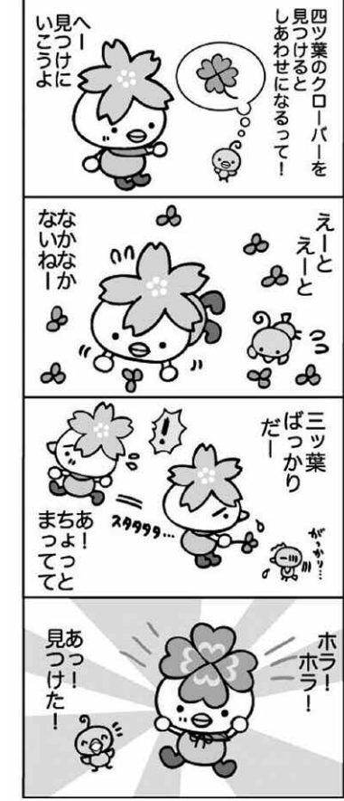
大河原町観光物産協会HP上で連載中 http://www.oogawara.com