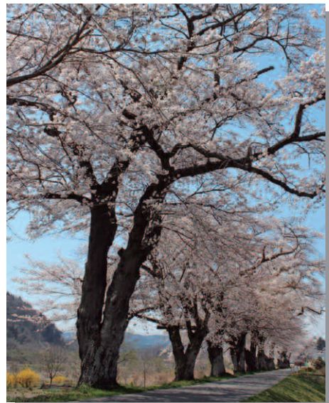
桜並木の始点付近(金ヶ瀬)