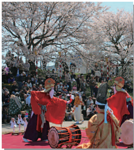
老木の補植が進む桜堤のように、伝統芸能にも若い世代が