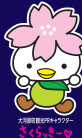
大河原町観光PRキャラクター さくら、きー♡