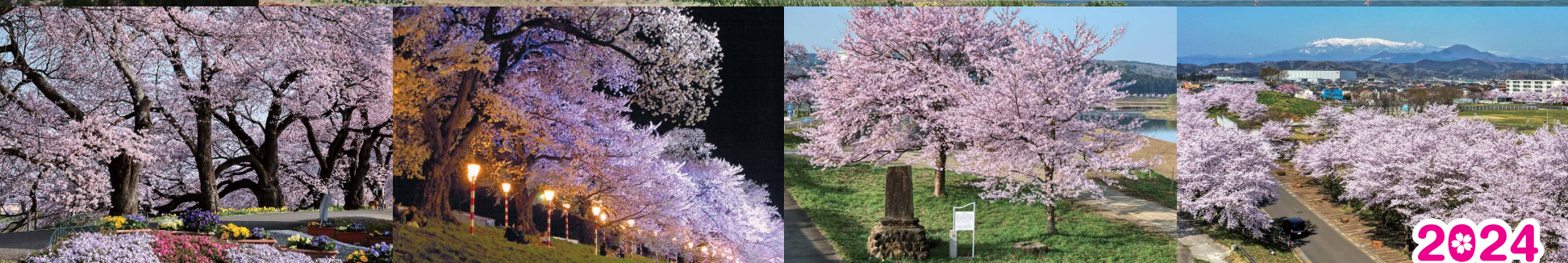
白石川から望む一目千本桜(ひとめせんぼんざくら)