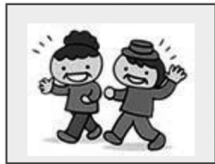
①専用歩数計を持って歩きます。