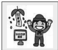
③月・年の合計歩数を表示。歩数目標達成が確認できます。