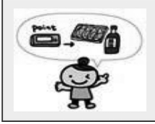
④歩数にポイントが付き、年合計ポイントによりプレゼントが抽選で当たります。