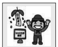
③月・年の合計歩数を表示。歩数目標達成が確認できます。