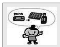
④歩数にポイントがつき、年合計ポイントにより地場産品等が抽選で当たります。