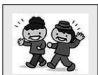
①専用歩数計を持って歩きます。