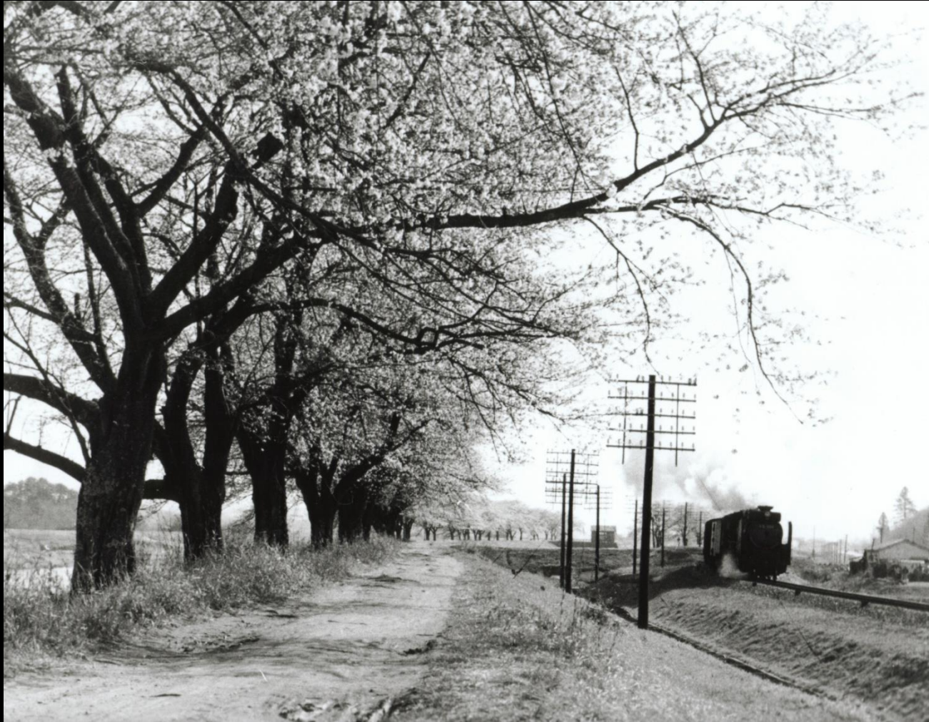
昭和36年に姿を消した、汽車ポツポ