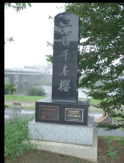
「一目千本桜」 記念碑