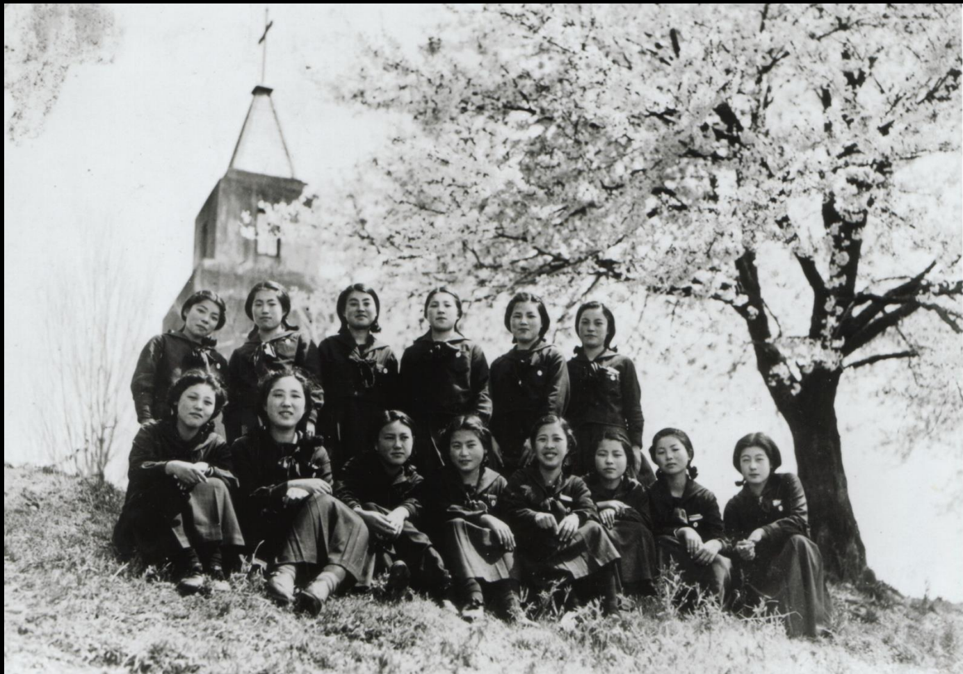
白石高等女学校(白石女子高校の前身)の乙女たち(昭和10年頃)