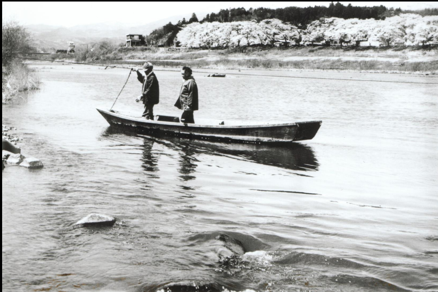
金ヶ瀬と上大谷を結んだ渡し船(昭和40年頃)