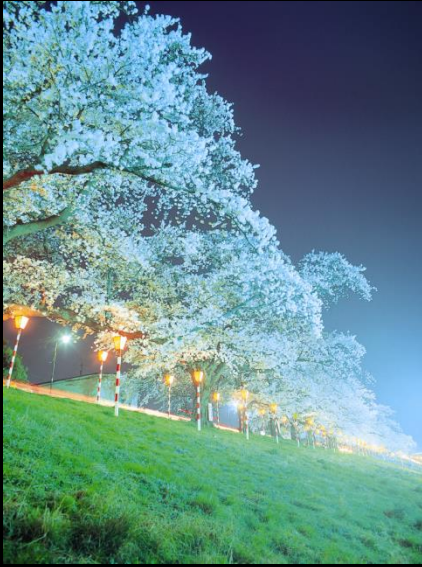
夜桜ライトアップ

桜の開花に合わせて、おおがわら桜まつりが開催されます。一斉に咲き誇る桜の姿は壮観であり、ライトアップされた夜桜は川面に映り、幻想的な美しさです。