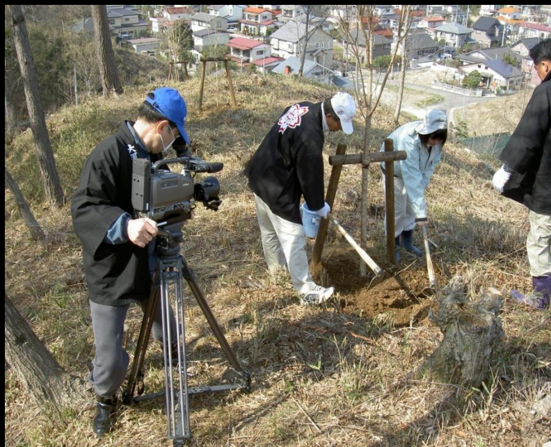
柴農生と共に「センダイヨシノ」の植樹