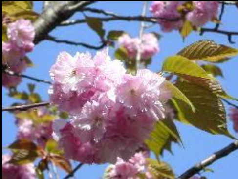
ヤエザクラは濃いピンク色

「一目千本桜」のほとんどがソメイヨシノですが、後から補植されたものに、「シロヤマザクラ」や「ヤエザクラ」があります。どちらもソメイヨシノの1～2週間後に花を咲かせます。ソメイヨシノと違い、花と葉が同時に出ます。