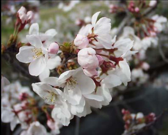
ソメイヨシノの可憐な花

サクラは、バラ科サクラ属の植物です。「ソメイヨシノ(染井吉野)」は、江戸時代の末期に染井村(現在の東京都豊島区)の植木職人が「吉野桜」という名で売り出したのが始まりです。