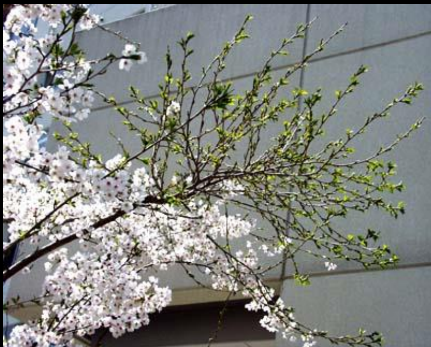
テングス病にかかった枝

テングス病は、桜の大敵です。病原菌が進入すると、一ヶ所から小さな枝がホウキ状にたくさん出ます。この枝は花が咲かなくなり、そのままにしておくと、木全体がテングス病にかかり、最後には枯れてしまいます。見つけたら、すぐに切り落とさなければなりません。