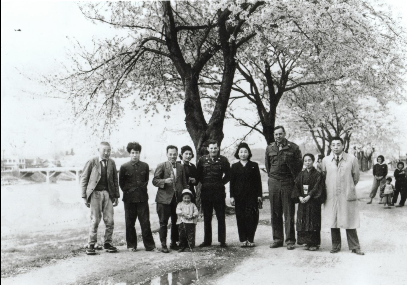
進駐軍も花見に来ていました。(昭和22年)