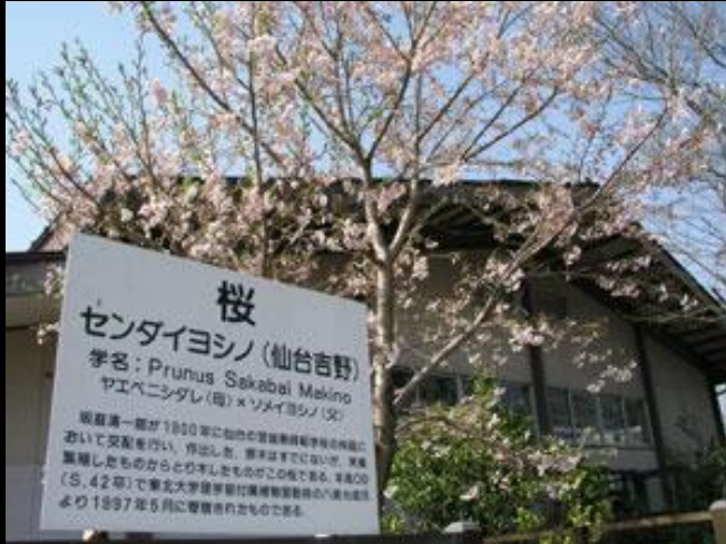
柴農敷地内に咲いたセンダイヨシノ