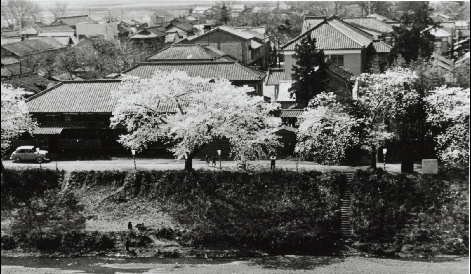
旧役場前の桜並木。土手でひと休み（昭和37年） ※昭和38年に上町～本町間の桜並木は伐採されました。