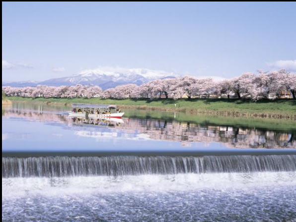
平成13年登場の屋形船

船を運航するには70cm以上の水深が必要なため、運航期間中は葦神堰の水門を閉めてもらっています。