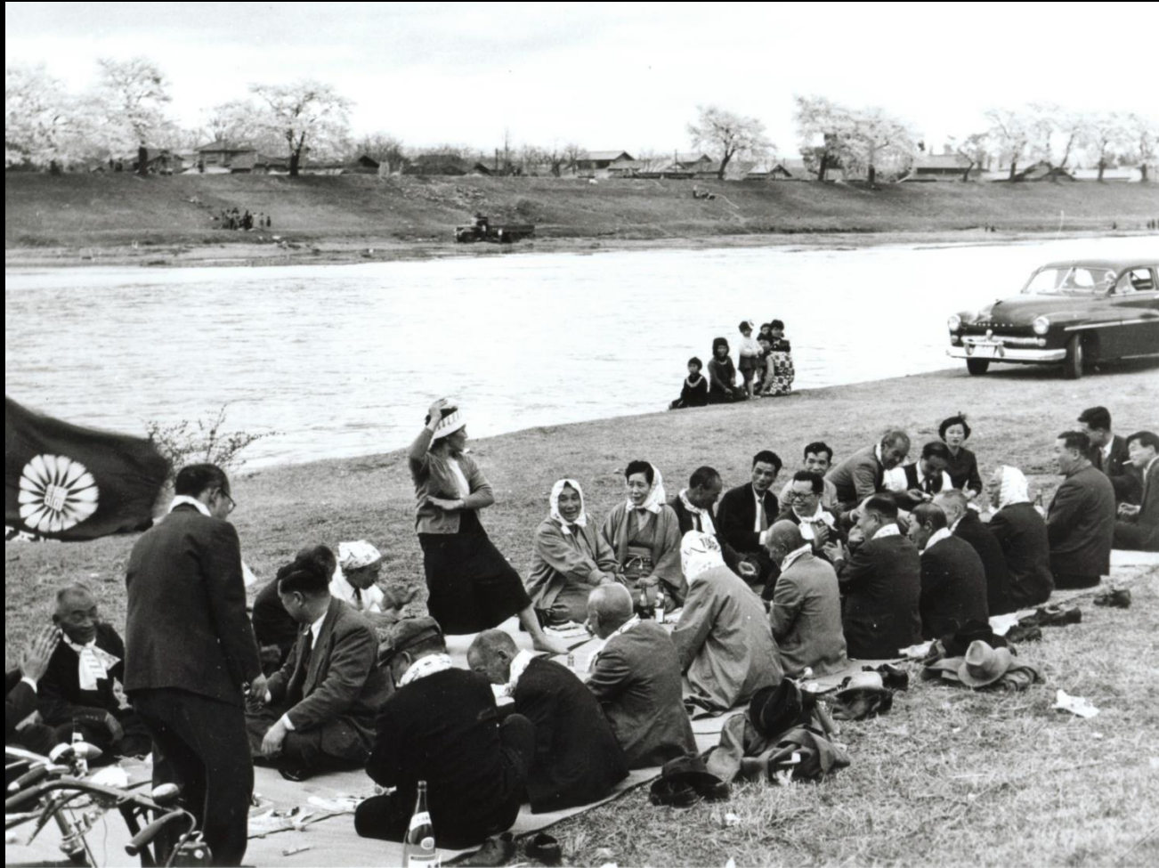
花見で陽気に踊るご婦人と、あ然と見ている子供たち(昭和30年)