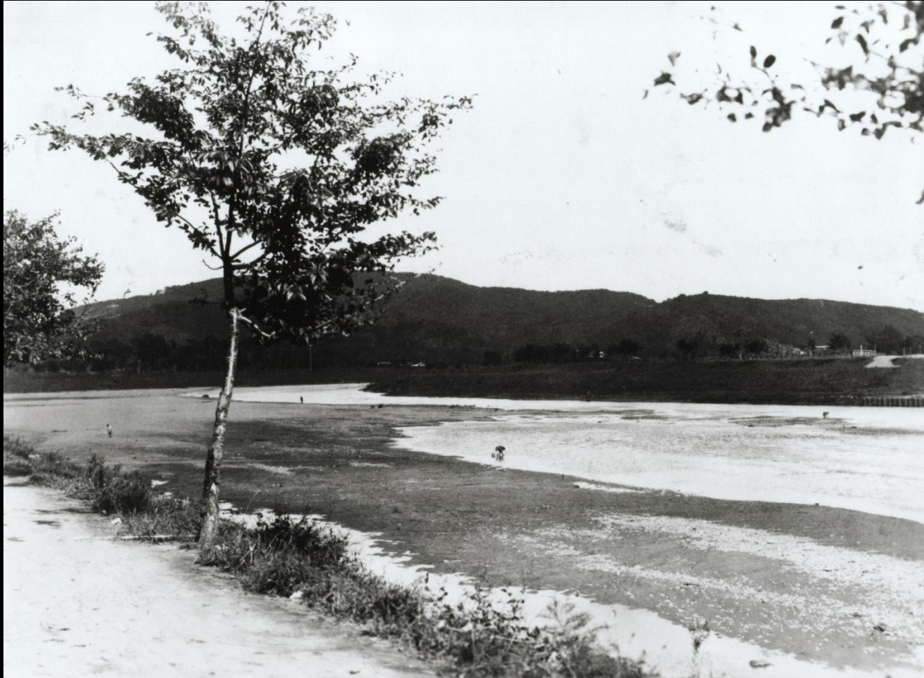
植樹後間もない桜。後ろの山は菘神山(昭和6年)