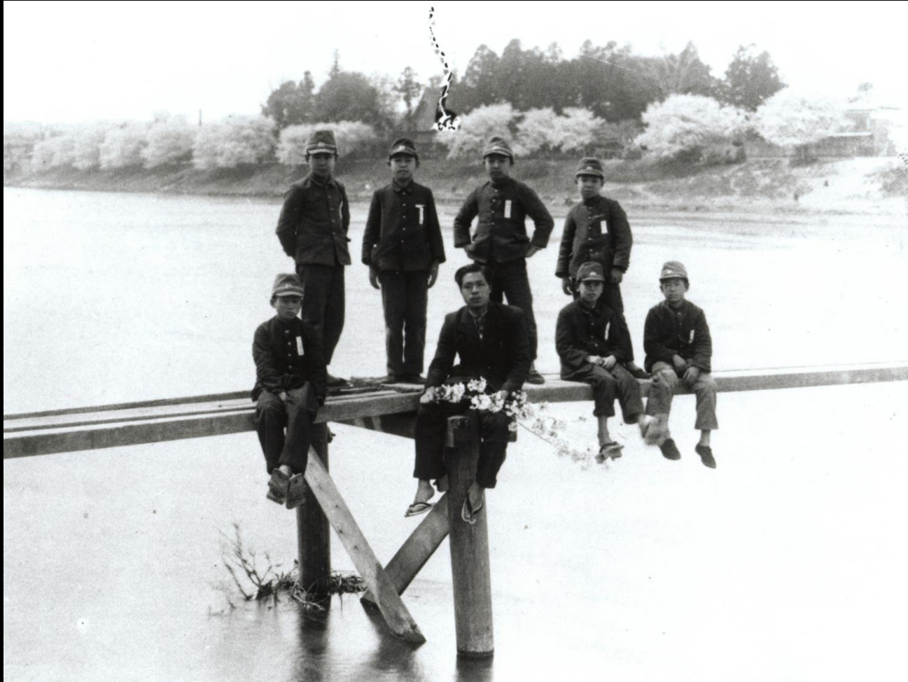
末広橋の前身、仮橋にて。中町・本町にも桜並木が(昭和19年頃)