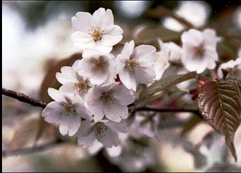
シロヤマザクラの白い花

「一目千本桜」のほとんどがソメイヨシノですが、後から補植されたものに、「シロヤマザクラ」や「ヤエザクラ」があります。どちらもソメイヨシノの1～2週間後に花を咲かせます。ソメイヨシノと違い、花と葉が同時に出ます。