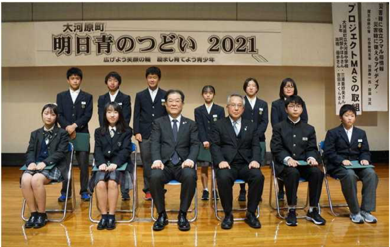
齋町長から賞状が手渡された表彰者