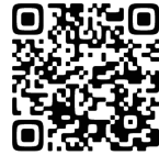
確定申告書等作成コーナー

国税庁ホームページの「確定申告書等作成コーナー」を利用し、ご自宅でお持ちのパソコン・スマートフォンを利用した確定申告書作成を推進しています。作成した申告書はe-Taxまたは印刷して郵送による提出ができます。