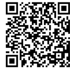
国税庁LINE公式アカウント

申告書作成会場の混雑緩和のため、会場の入場に「入場整理券」が必要となります。「入場整理券」は、各申告書作成会場における当日配布かLINEによる事前発行により取得してください。