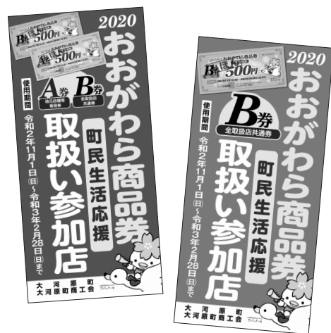
この店頭ポスターが目印です