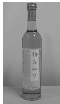
500ml (5倍希釈) 1,200円 (税込)

問合せ先 大河原町観光物産協会 (大河原町にぎわい交流施設内) ☎0224-53-2141