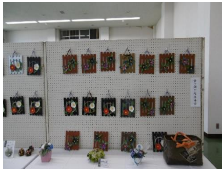
金ヶ瀬下町長寿会の手工艺品