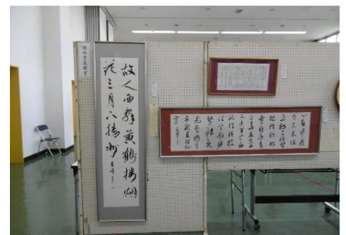
課外書道教室の展示