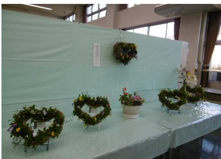
花の寄せ植えコーディネート教室