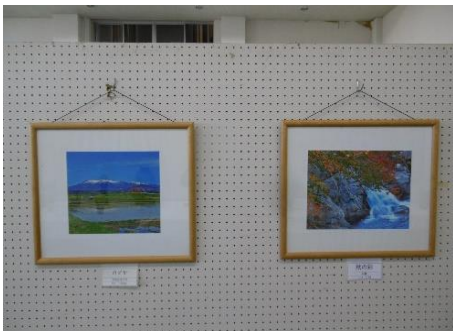
金ヶ瀬フォトクラブ