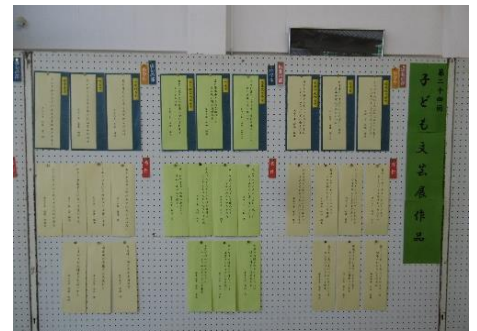
子ども文芸展の入選作品