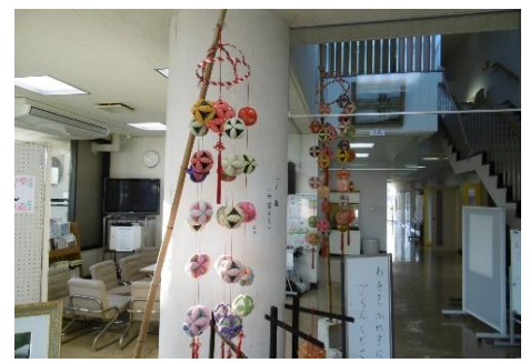
つるし雛七宝まり

その他にも、絵画・押花・模型など様々な個人作品が展示されました。出展された皆様、ありがとうございました。