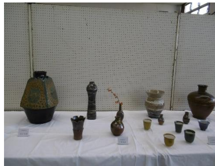
金ヶ瀬陶芸愛好会の展示