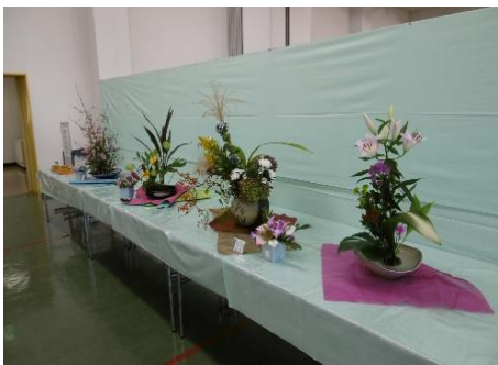
櫻花倶楽部の生花

10月29日(土)・30日(日)に、秋晴れの中、3年ぶりの町民文化祭(展示の部)が開催されました。たくさんの方々から作品を展示していただき、大いに盛り上げることができました。準備運営にご協力いただいた皆様、ありがとうございました。