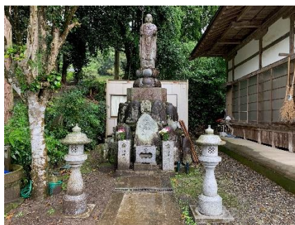
供養塔 中央に白峯院の墓碑