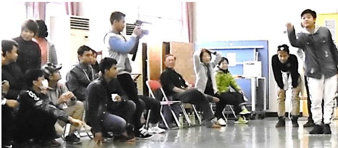
ビデオを撮りながら応援するチームメート