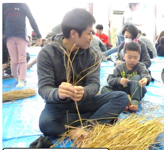
上手になれるかな?