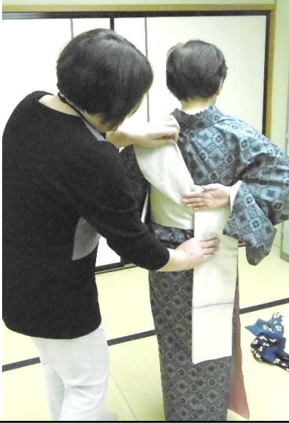
帯の締め方を教わっています

11月から12月にかけて、ボランティア講師による着付け教室(全5回)が開催されました。