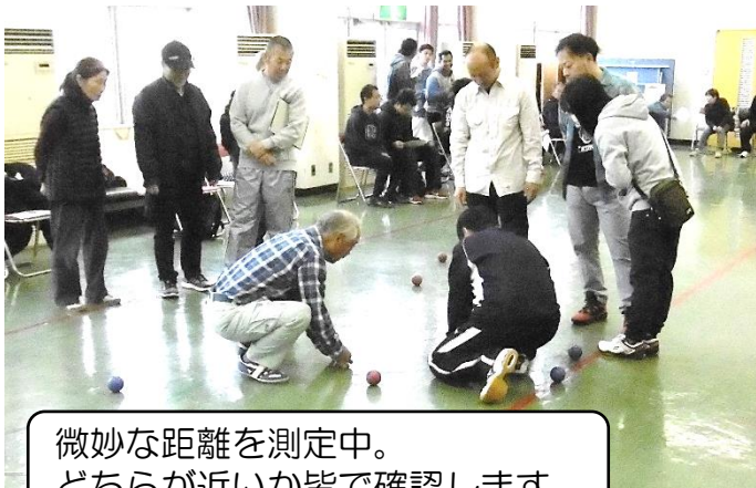
微妙な距離を測定中。 どちらが近いか皆で確認します

11月24日(日)、毎年恒例金ヶ瀬地区ペタンク大会が開催されました。ペタンクとは、カーリングのように投げたボールを目標(ビュット)に近づけ、相手のボールより近づけることで得点を競うニュースポーツです。