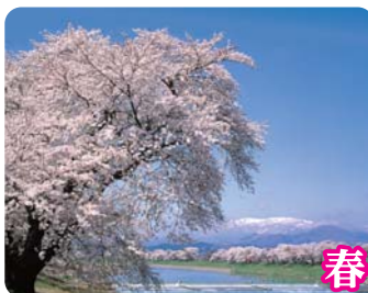
おおがわら桜まつり (一目千本桜)