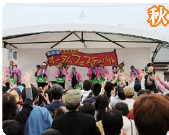
おおがわらオータムフェスティバル