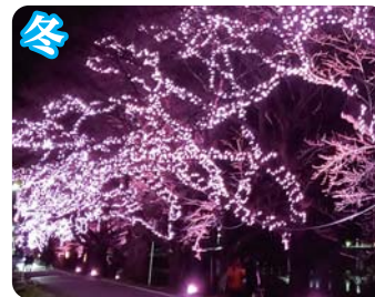
おおがわら桜イルミネーション