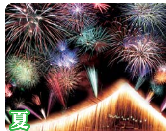
おおがわら夏まつり