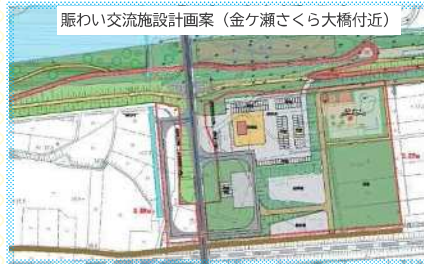
賑わい交流施設設計画案 (金ヶ瀬さくら大橋付近)