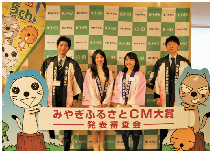
▲ CMを作成した町職員。

審査会の様子は、1月3日（金）午後4時にKHB 東日本放送で放送予定です。ご家族そろってぜひご覧ください。