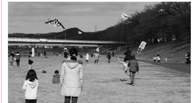
▲会場は多くの参加者でにぎわいました。

また、たこあげ大会恒例の餅つき大会とミニカップラーメン食べ放題が用意され、そちらも参加者に好評でした。