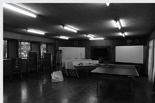
◎平成30年度 宝くじ助成金交付団体（大河原町）

今年度の交付金で整備された備品（上町集会所。各種行事での活用を通して、コミュニティ活動の活性化が期待されます。