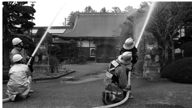
▲消防署員と消防団員による繁昌院での放水訓練。