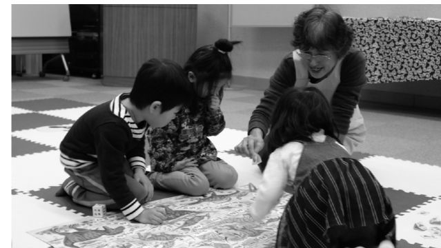
▲すごろくに興味津々な子どもたち。

読み聞かせボランティアの皆さんによる読み聞かせでは、絵本だけでなく、手作りのパネルや仕掛けのあるエプロンを使ったものなど、趣向を凝らしたもので、小さいお子さんも大喜び。読み聞かせ終了後は、コマやけん玉、羽根つきに福笑いなどの昔ながらの遊び道具が用意され、参加者はボランティアのかたに遊び方を教わりながら、お正月遊びを堪能しました。