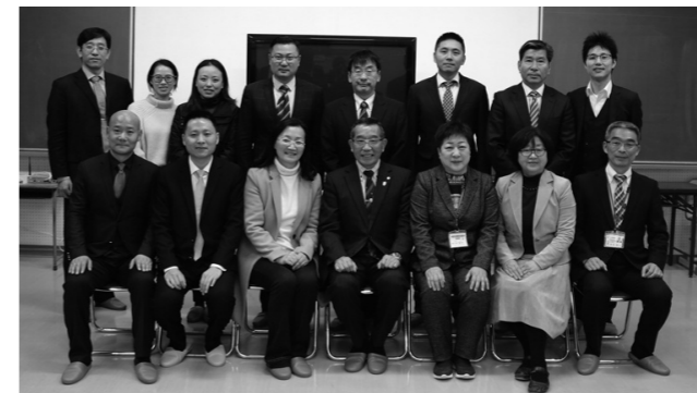
▲薬教育長を中心に、町内小中学校長と中国人訪問者の皆さん。

その後は、中国人訪問者と町内小中学校の校長先生との意見交換会が行われ、「日本の児童が真面目で礼儀正しいのはなぜか」「今後お互いに交流事業が可能なのか」など、様々な意見が交わされました。