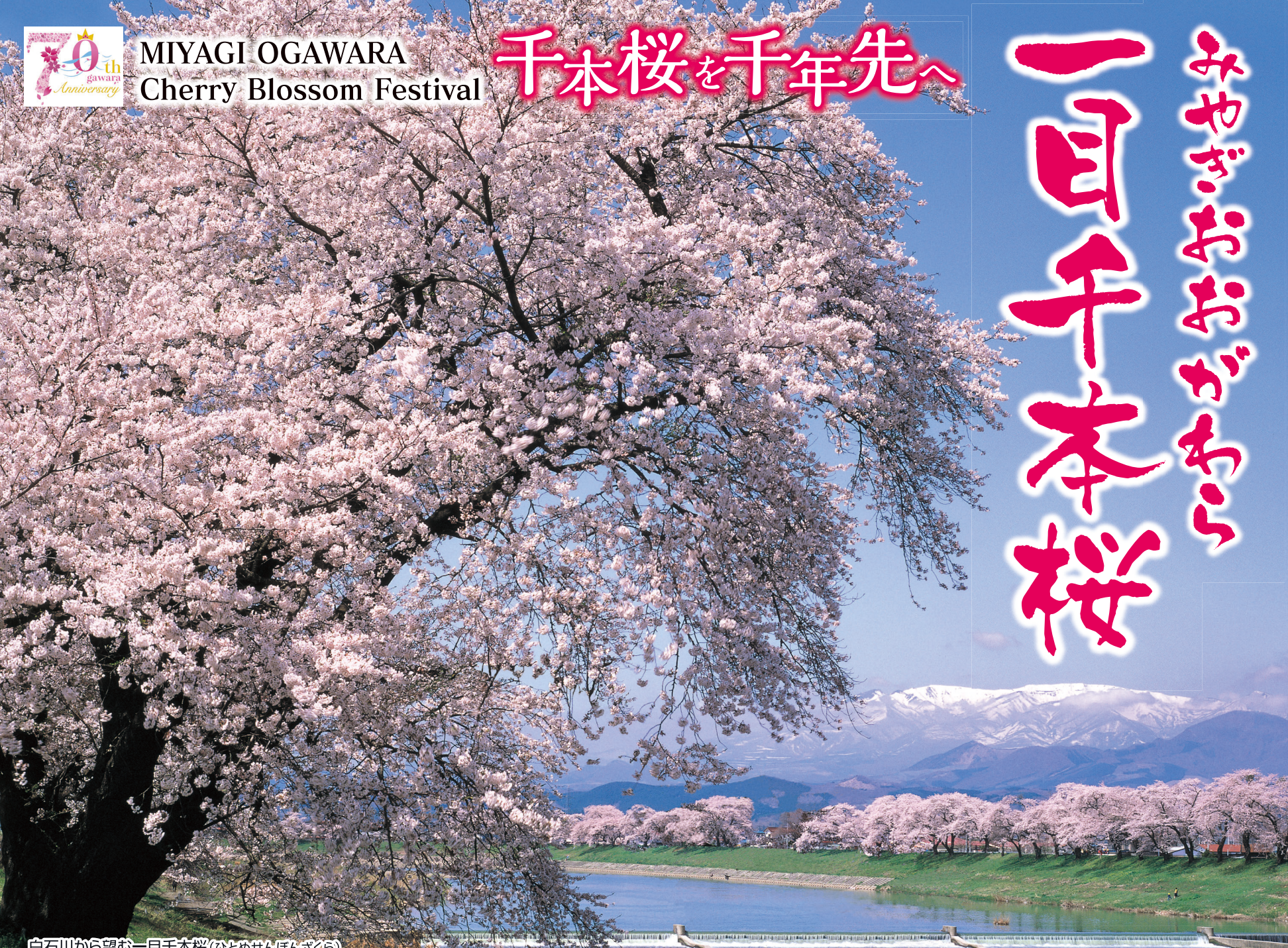
白石川から望む一目千本桜(ひとめせんぼんざくら)

桜絶景スポットの「直神堰」は現在改修工事のため、 架台が設置されており近づけません。 ※画像は改修工事前のものです。