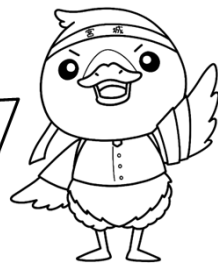
みやぎハローワークキャラクター 「ガンちよーさん」