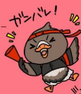
みやぎハローワークキャラクター 「ガanchyoさん」