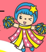
宮城県福祉人材センター マスコットキャラクター 「ふくしのほっぴい」