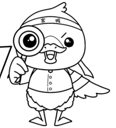
みやぎハローワークキャラクター 「ガンちよーさん」