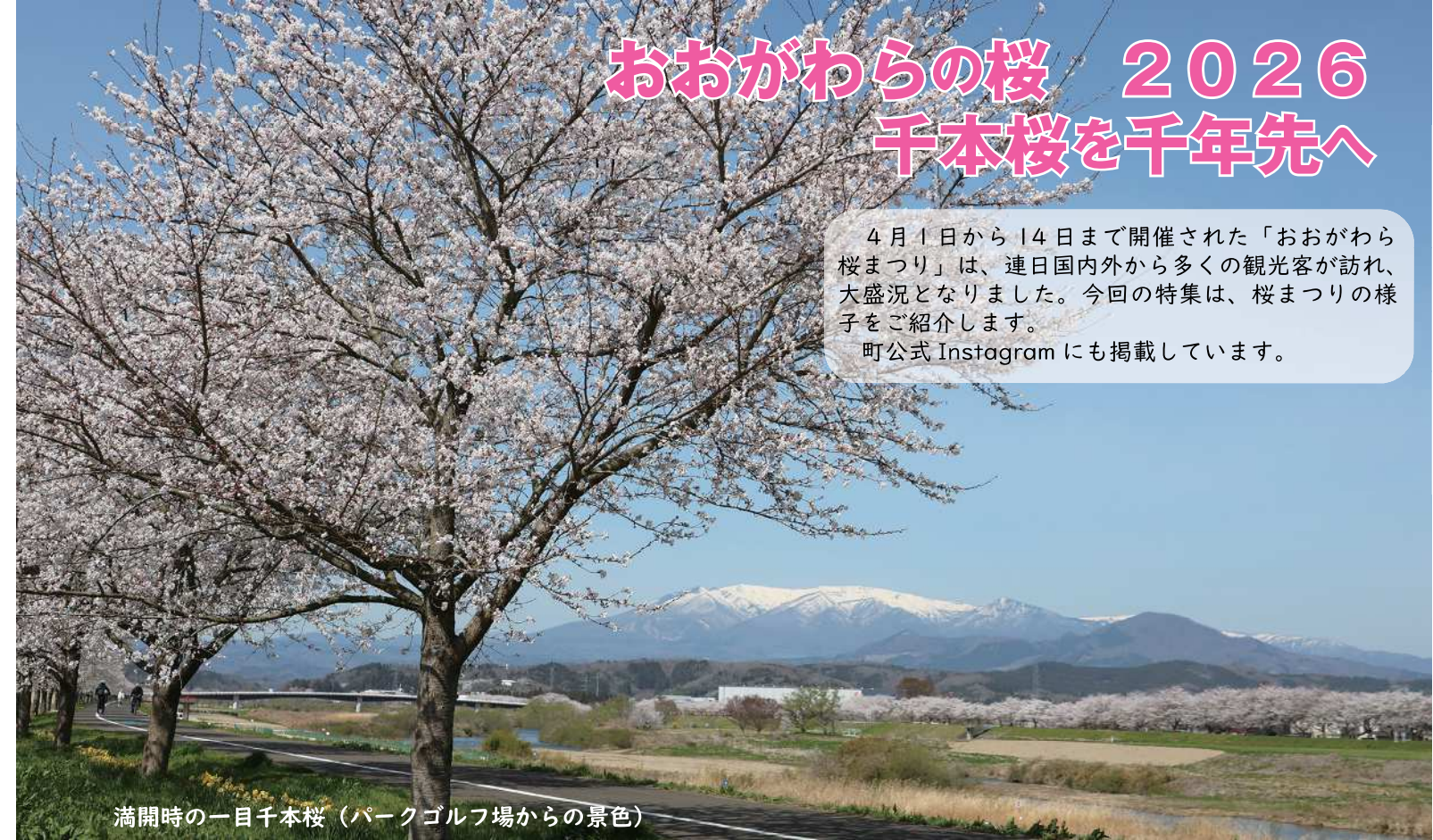
満開時の一目千本桜 (パークゴルフ場からの景色)

4月1日から14日まで開催された「おおがわら桜まつり」は、連日国内外から多くの観光客が訪れ、大盛況となりました。今回の特集は、桜まつりの様子をご紹介します。 町公式 Instagram にも掲載しています。