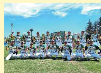
▲ 全日本実年ソフトボール大会に出場された皆さん