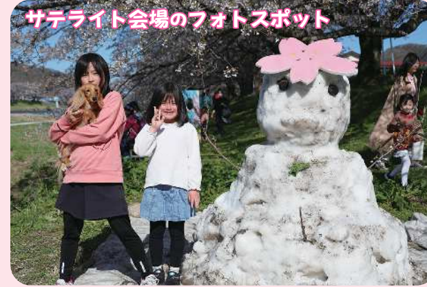
サテライト会場のフォトスポット