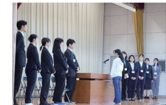
▲ 着任式で児童代表の挨拶を受ける転入職員

また2年、4年、6年の代表児童が、自分が立てた1学期の目標を原稿を見ないで発表しました。3人の堂々たる姿に全校児童からは大きな拍手が送られました。