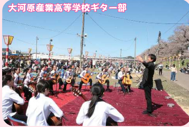
大河原産業高等学校ギター部