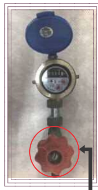
水 抜 栓