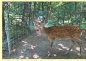
▲金華山出身の鹿の立派な角は春に生え変わったばかり。

里山に囲まれた自然の中にあるとんとんの丘「わんぱくの森」には、カピバラやダチョウをはじめ、現在16種類約100匹の動物たちがいます。春には動物たちの赤ちゃんが生まれ、羊の毛刈り(今年は中止)等のイベントも行われ、夏にはカブトムシやクワガタに出会う事もできます。施設内には展望台や、大きなすべり台、ブランコ等のアスレチックもあり、子ども達だけでなく大人も楽しめる施設になっています。なかなか気軽に遠出が出来ない日々が続いていますが、自然の中で動物とふれあいながら過ごしてみたいと思いませんか？