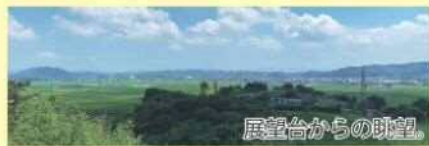
展望台からの眺望。

【とんとんの丘】 新寺字北185-11 ☎0224-52-2107 10:00～17:00 第3水曜日定休 (祝日の場合は翌日)