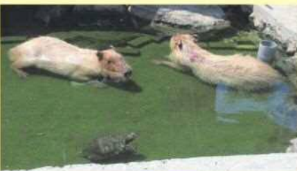
▲カピバラと亀は仲良く温泉に入浴中。