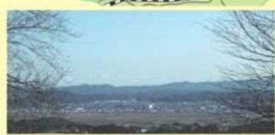
▲天狗森山展望台からの眺望。