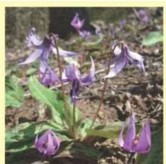
▲うす紫色の可憐な花を咲かせるカタクリは、3月下旬から4月中旬にかけて観察できます。