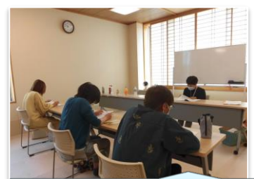
子どもの栄養と食生活